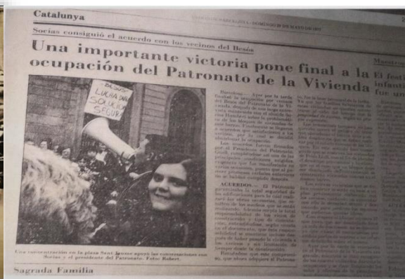
Diari de Barcelona, maig 1977